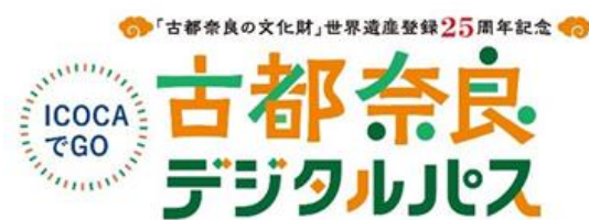
▲「ICOCAでGO 古都奈良デジタルパス」 ロゴマーク

公益社団法人 奈良市観光協会（所在地：奈良市三条本町、会長：乾昌弘）と西日本旅客鉄道株式会社は、「古都奈良の文化財」の六社寺（東大寺・興福寺・春日大社・元興寺・薬師寺・唐招提寺）を巡ることができる「古都奈良六社寺共通拝観券」と、JR線自由周遊区間（大阪・京都～奈良エリア）の利用がセットになったデジタルパス「ICOCAでGO 古都奈良デジタルパス」を、アプリ「KANSAI MaaS」にて発売を開始いたしました。販売期間は2024年2月28日（水）まで、利用期間は2024年2月29日（木）までの連続する2日間。料金はおとな一人あたり6,000円で、子ども料金の設定はありません。