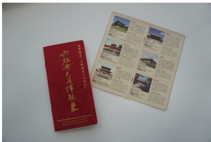
▲「古都奈良六社寺共通拝観券」

ぜひこの機会に「ICOCAでGO 古都奈良デジタルパス」を活用し、「古都奈良の文化財」を巡ってみませんか？概要は以下の通りです。